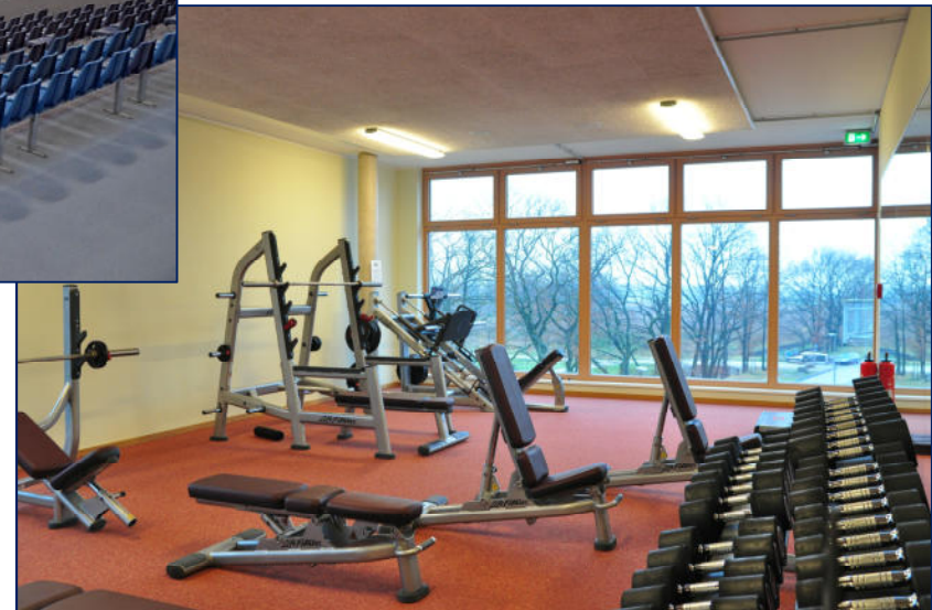
BGZ Süderelbe, Grundschule am Johannisland